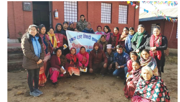
कृषक स्तर विषादी सचेतना कार्यक्रम