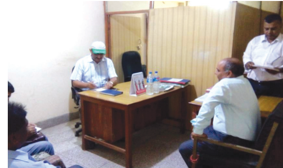
सुख्खा बन्दरगाहमा रहेको प्लाण्ट क्वारेन्टिन कार्यालयमा अनुगमन