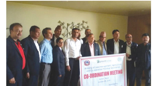
प्रदेशस्तर भूमि व्यवस्था, कृषि तथा सहकारी मन्त्रालयका सचिवज्यूहरूसँग समन्वय बैठक