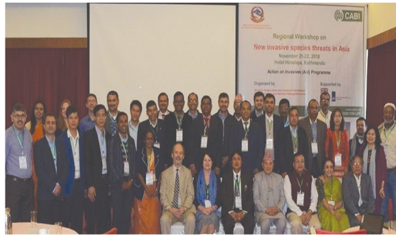
Regional Workshop on New Invasive Species threat in Asia