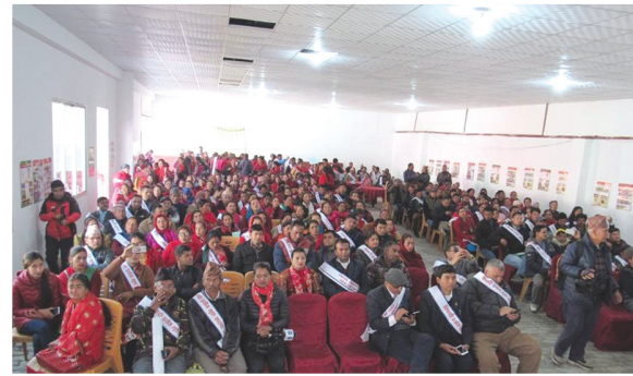
राष्ट्रिय स्तरमा विषादी प्रयोग मुक्त सप्ताह फागुन ६-१२