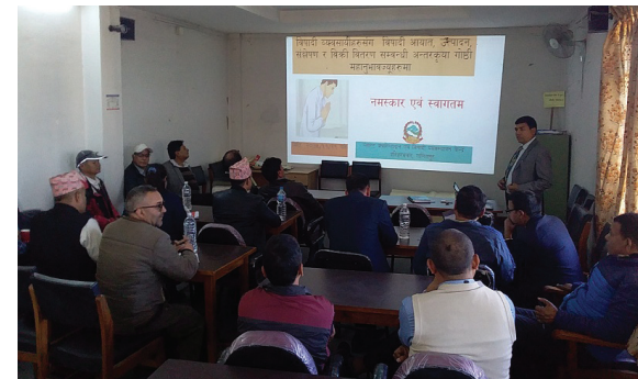
Interaction Program with Pesticide Entrepreneurs