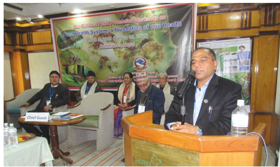
राष्ट्रिय बाली संरक्षण संगठन