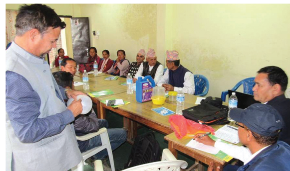
शत्रुजिव मुक्त क्षेत्र सहयोग कार्यक्रम, स्याङ्जा