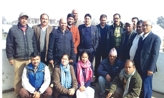
इलेक्ट्रोनिक फाइटोसेनेटरी सिस्टम म्यानेजमेन्ट तथा सन्चालन तालिम