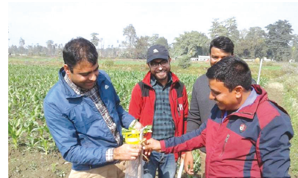
Fall Armyworm सभे सभेलेन्स, सुनसरी