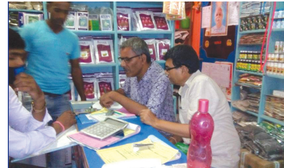
विषादी थोक विक्रेतासँग अन्तरक्रिया तथा अनुगमन, वीरगञ्ज