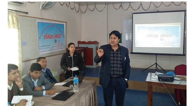
Second Trimester and Eight Monthly Progress Workshop