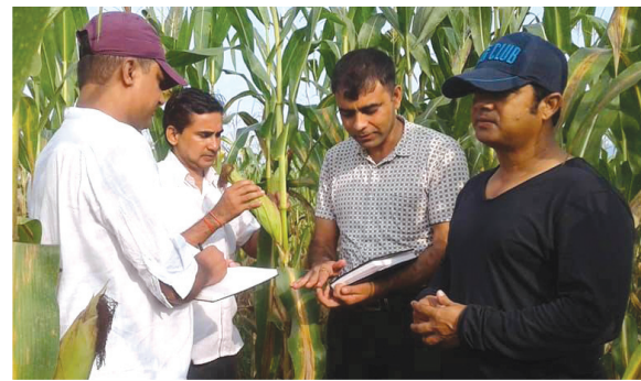
सभे सभेलेन्स, मकै सुपरजोन डाइ