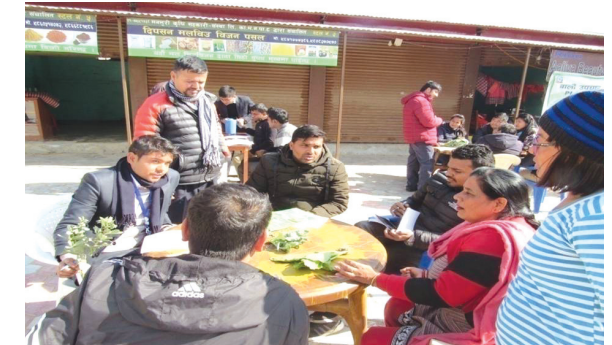
अधिकृतस्तरीय प्लाण्ट क्लिनिक तालिम प्रयोगात्मक अभ्यास